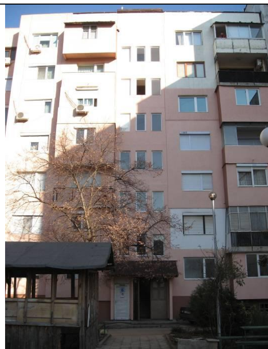
Западна фасада, бл.7, вх. "Б"