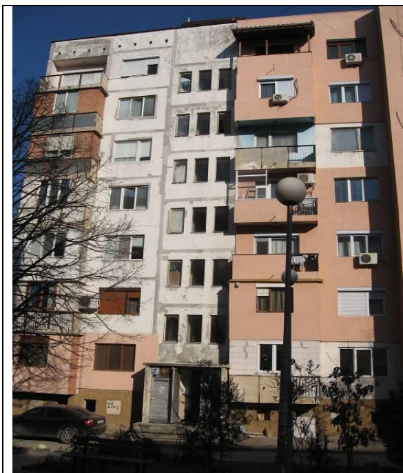
Западна фасада, бл.7, вх. "А"