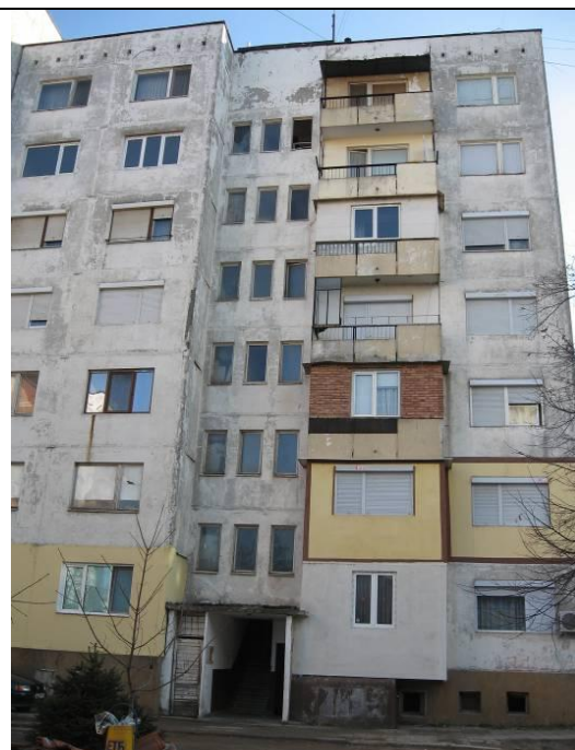
Северна фасада, бл.8