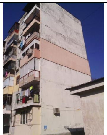
Югоизточна фасада, бл. 16