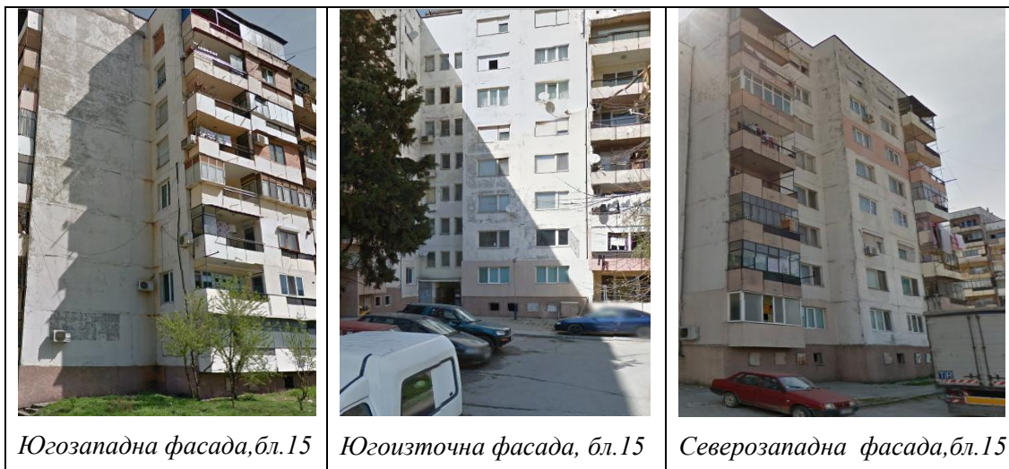
Югозападна фасада, бл.15