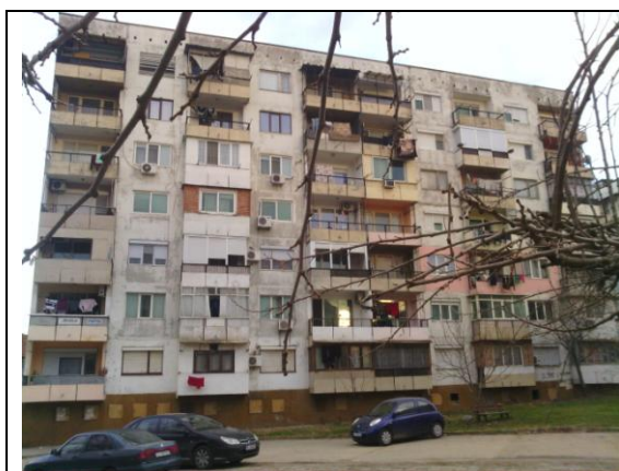
Югозападна фасада, бл.9