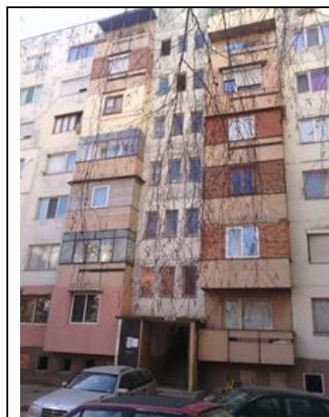
Западна фасада, бл. 16

Снимки на многофамилната жилищна сграда: