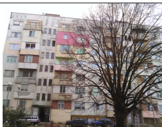
Западна фасада, бл.9