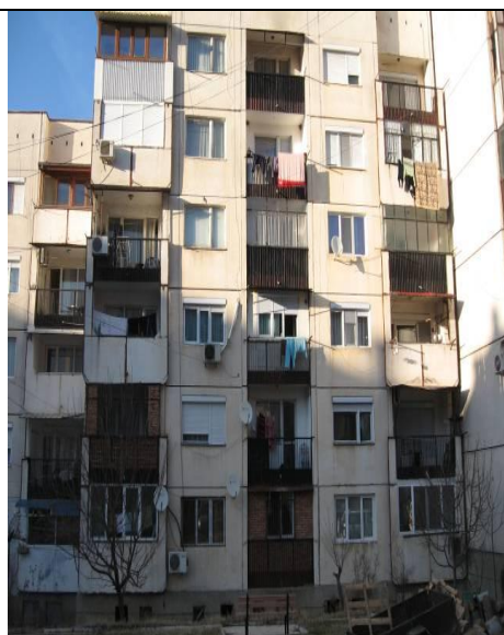
Южна фасада, бл.4