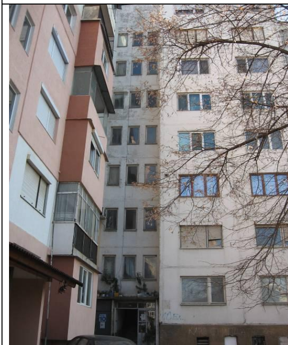
Северна фасада, бл.10