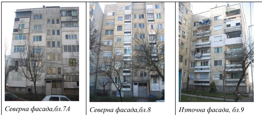
Северна фасада, бл. 7А